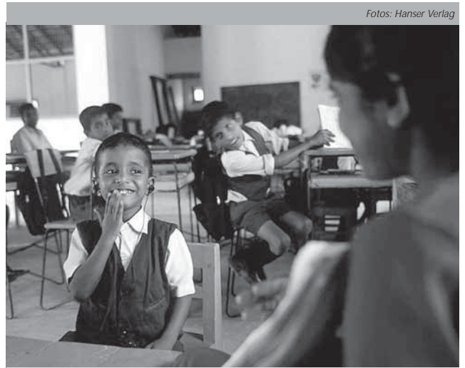
...verwundete Seelen in Sri Lanka heilen.