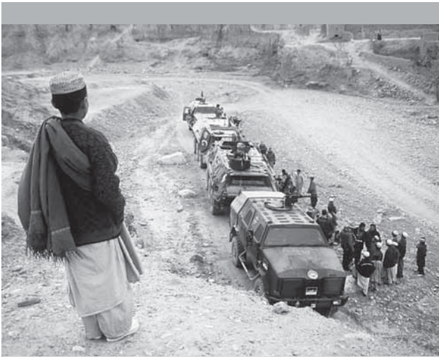
Eiserne Karawane in Afghanistan begleiten und...

Friedensmacher: Peace Counts-Expedition in Wort und Bild dokumentiert