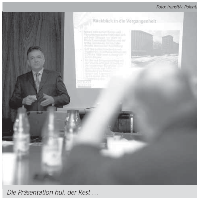
Die Präsentation hui, der Rest ...

zu vermeiden, wolle man ihn von nun an etwas mehr aus der Distanz agieren lassen. Mit der Suche nach Investoren scheint es gar nicht so gut voran zu gehen, denn der Go-East-Investor hatte nichts zu bieten außer der Versicherung, dass man in Paris gewesen sei und auch anderweitig Gespräche führe. Von dünnem Eis, auf dem man stehe, war da auch zu hören. Auf die Frage, wie es denn um die angekündigten Partner in Dubai stehe, folgten nur eine müde wegwerfende Handbewegung und rascher Themenwechsel. Ein Masterplan werde in einigen Wochen Auskunft geben, wie dereinst auf dem Gelände