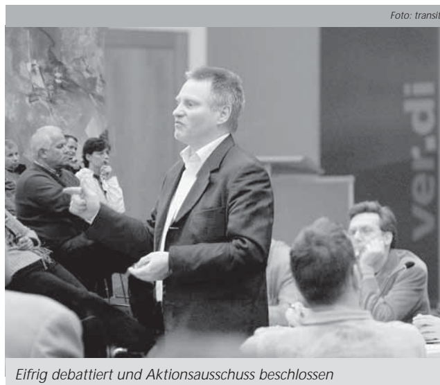
Eifrig debattiert und Aktionsausschuss beschlossen

Millionen Euro ein, 2007 fast 24 Millionen und 2008 knapp 27 Millionen Euro. Letzteres wäre für das Verlagsgewerbe eine bislang kaum erreichte Umsatzrendite von