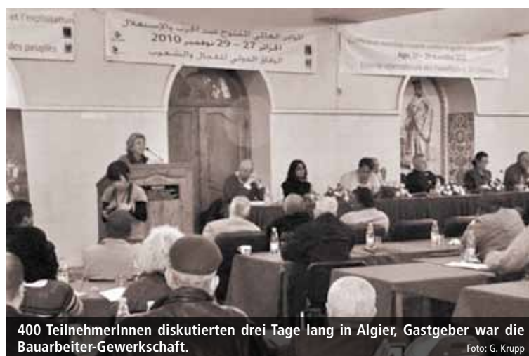
400 TeilnehmerInnen diskutierten drei Tage lang in Algier, Gastgeber war die Bauarbeiter-Gewerkschaft.

über Maßnahmen zur Begleitung der Krise zu verständigen.« Verhandlungen respektierten die unterschiedlichen Interessen, während der Soziale Dialog die Existenz entgegengesetzter Interessen leugne und die Gewerkschaften in eine »soziale Begleitung« eines gemeinsamen Krisenmanagements integrieren wolle. »Nach allen Erfahrungen heißt das aber