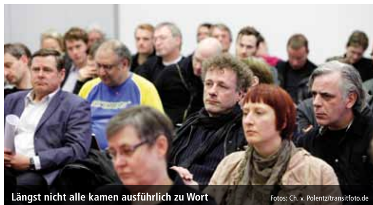
Längst nicht alle kamen ausführlich zu Wort

sembles. Kollegen aus den Werkstätten des Maxim-Gorki-Theaters sahen die Gefahr, perspektivisch dem Bühnenservice der Opernstiftung angegliedert zu werden. Auf »enorme Probleme« im Neubau der Zentralwerkstatt der Opernstiftung wiesen dort Beschäftigte hin und forderten, endlich einen Geschäftsführer einzusetzen. Eine Kollegin sprach für freie TänzerInnen und KleindarstellerInnen, deren Gagen immer weiter sinken und selbst zwischen den Opernhäusern differieren. Die »unsägliche GmbH« des BE und die Tatsache, dass so jährlich öffentliche 11,5 Mio. Euro »in einen autokratisch geführten Ein-Mann-Betrieb« gelangten, kritisierte Ströver. Die Konstruktion am BE sah auch Lange als »historisch entstandenen Fehler«,