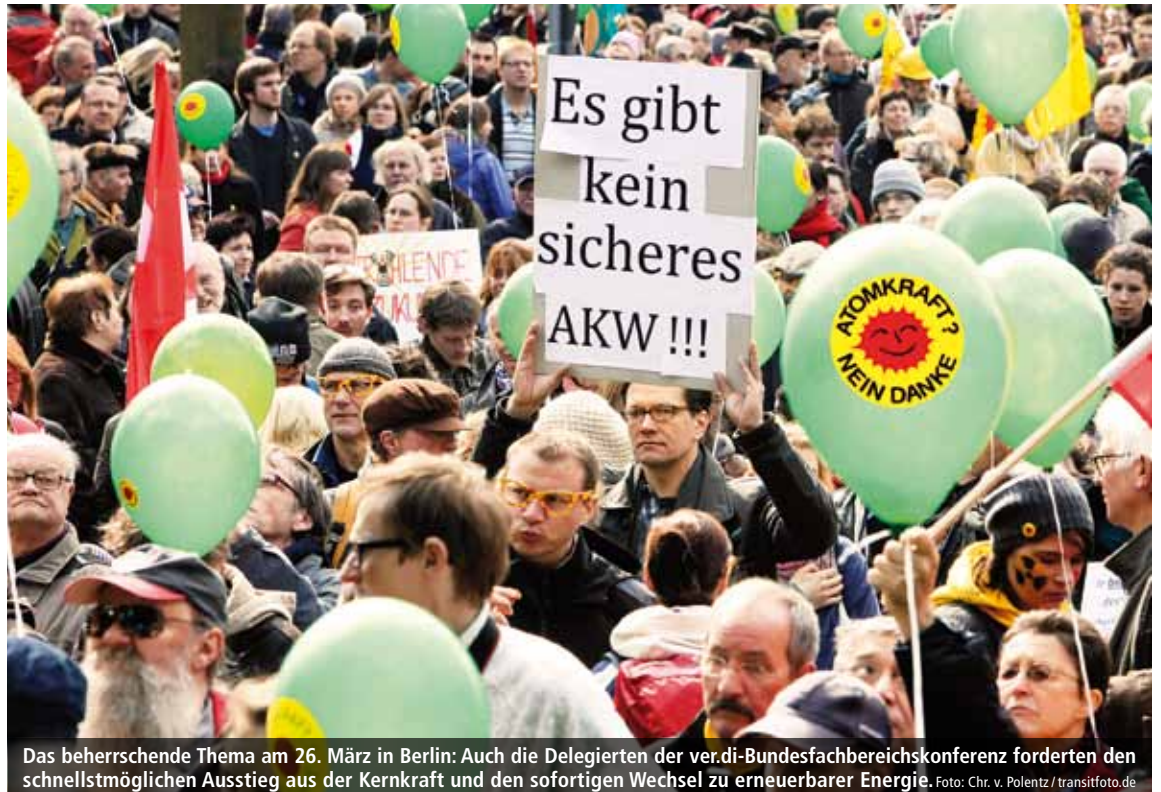
Das beherrschende Thema am 26. März in Berlin: Auch die Delegierten der ver.di-Bundesfachbereichskonferenz forderten den schnellstmöglichen Ausstieg aus der Kernkraft und den sofortigen Wechsel zu erneuerbarer Energie.

Der 1. Mai in Berlin beginnt um 9 Uhr mit Begrüßung und Musik vor dem DGB-Gewerkschaftshaus Keithstraße am Wittenbergplatz. Die Demos starten um 10 Uhr. Die Kolleginnen und Kollegen unseres Fachbereiches treffen sich dazu um 9.45 Uhr vor der Büchergilde. Der Demonstrationzug, einschließlich Skater-Demo, Motorrad- und Fahrradkorso, führt zum Brandenburger Tor. Auf der Bühne auf dem Platz des 18. März findet ab 11.30 Uhr die Mai-Kundgebung statt. Hauptrednerin ist Annelie Buntenbach vom DGB-Bundesvorstand. Anschließend wird das traditionelle Maifest mit Infomarkt gestaltet. Auf der Straße des 17. Juni schließt sich bis 19 Uhr ein Kinder-, Jugend- und Familienfest an.