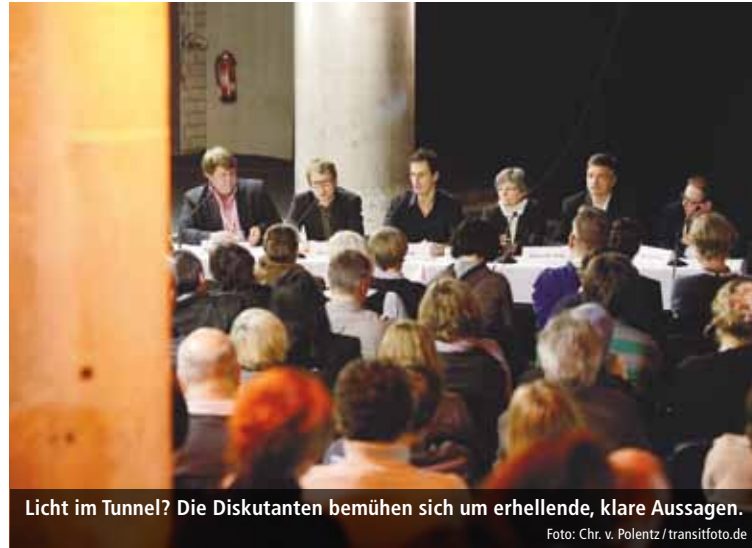
Licht im Tunnel? Die Diskutanten bemühen sich um erhellende, klare Aussagen.

Eine Berlinale-Diskussion zur deutschen Film- und Fernsehproduktion