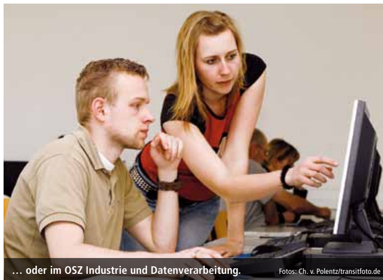
... oder im OSZ Industrie und Datenverarbeitung.

GewerkschafterInnen für die Prüfungsausschüsse zu finden«, sagt Wucherpfennig. Im IT-Bereich etwa gebe es noch nicht allzu viel Erfahrung mit der Ausbildung, trauten sich viele Kolleg/innen nicht zu, die