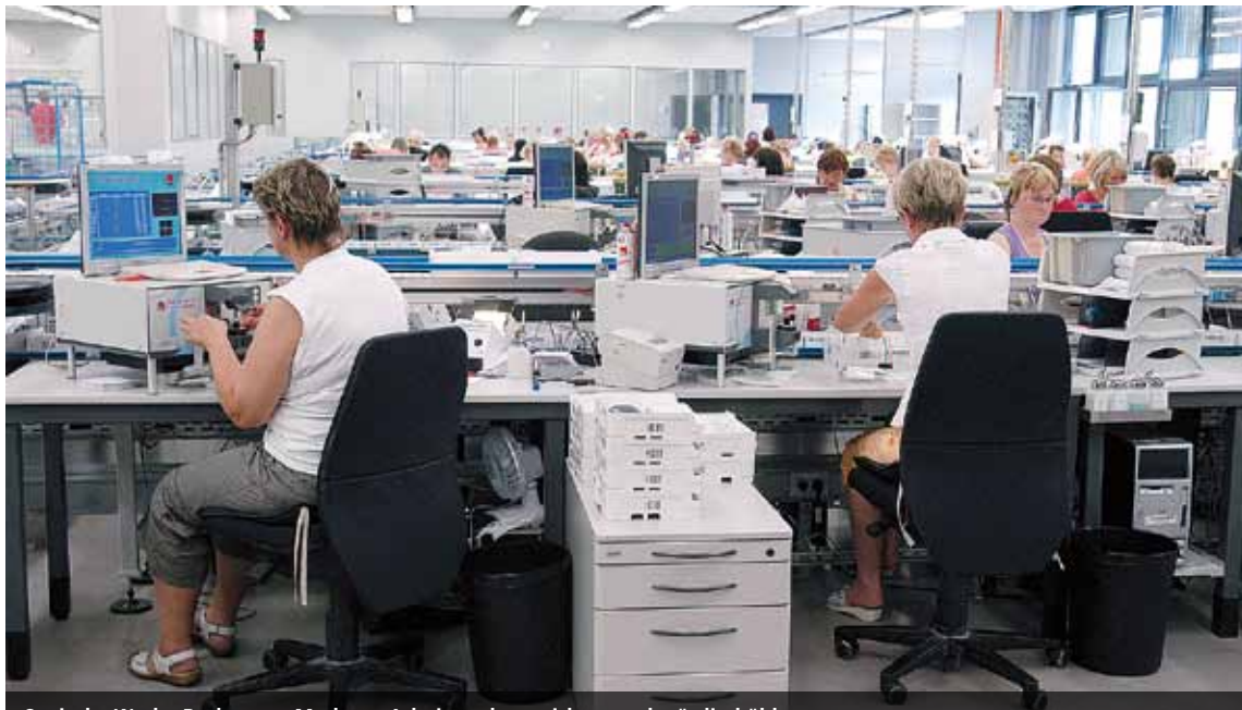
Optische Werke Rathenow: Moderne Arbeitswelten wirken merkwürdig kühl.

MedienGalerie zeigte fotografische Momentaufnahmen aus der Arbeitswelt