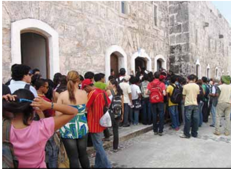
Bücher im Schaufenster: Anstehen ist hier ganz normal, alle kommen zur alten Festung zum jährlichen Buch-Supermarkt.

Mit ver.di wird Lesestoff auf die 20. »Feria internacional del Libro« gebracht