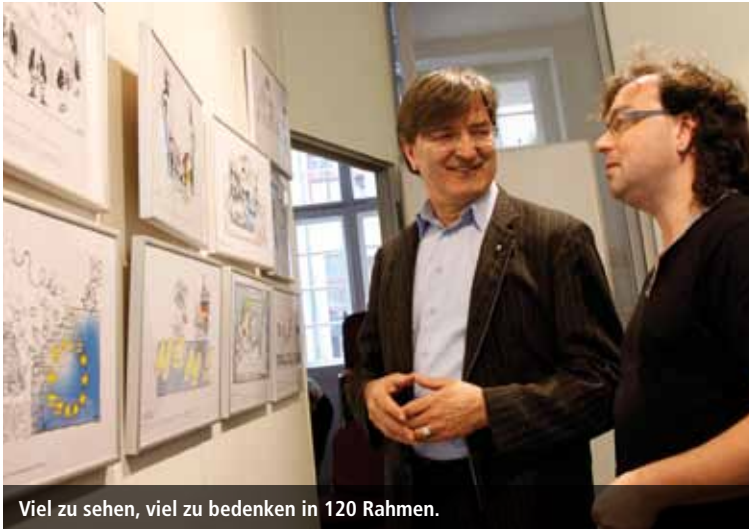
Viel zu sehen, viel zu bedenken in 120 Rahmen.