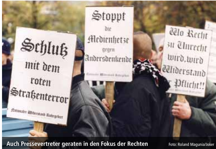
Auch Pressevertreter geraten in den Fokus der Rechten

Sind Ihnen auch aus der Region solche Angriffe gegen Journalisten bekannt?