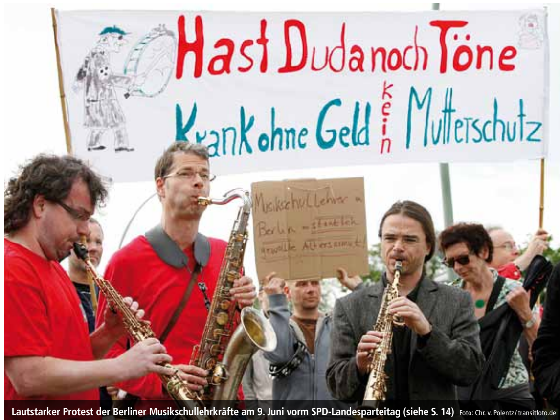
Lautstarker Protest der Berliner Musikschullehrkräfte am 9. Juni vorm SPD-Landesparteitag (siehe S. 14)