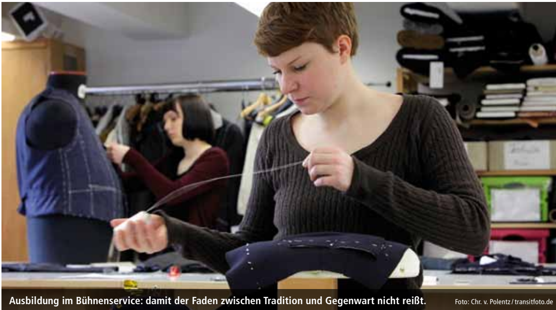
Ausbildung im Bühnenservice: damit der Faden zwischen Tradition und Gegenwart nicht reißt.