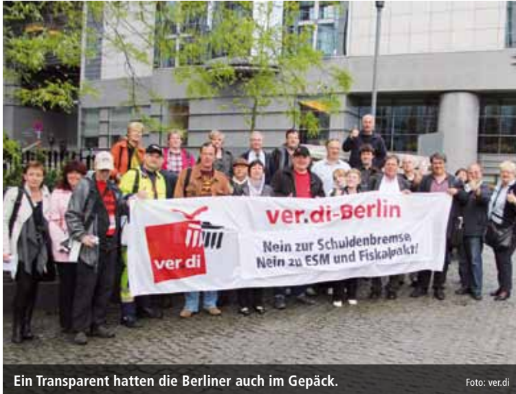
Ein Transparent hatten die Berliner auch im Gepäck.

Delegation des ver.di-Bezirks Berlin informierte sich und andere in Brüssel