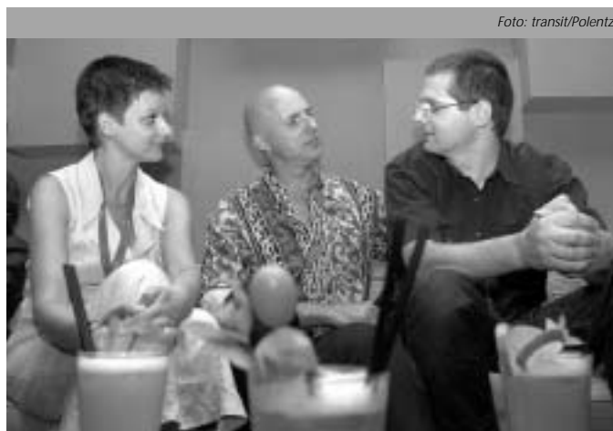
Seltene Gesprächsrunde der Radiomacher

Während im vergangenen Jahr zwischen den Waschmaschinen in Holly's Waschtheke die Situation am Hörfunkmarkt von rund