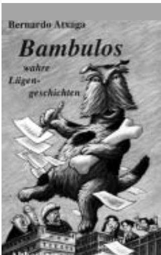
Nur noch Erinnerung an die...

Tradition unverwechselbarer Buchkunst geht verloren