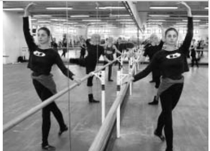
Ballett gehört zu Kunst und zur Lebensqualität.