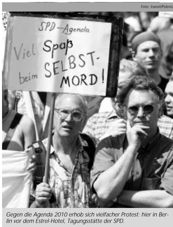
Gegen die Agenda 2010 erhob sich vielfacher Protest: hier in Berlin vor dem Estrel-Hotel, Tagungsstätte der SPD.

Seit die Kosten der Deutschen Einheit überwiegend aus diesen Töpfen bezahlt wurden, habe sich die Situation zugespitzt. Versuche, die Sozialkassen zu entlasten, blieben bislang konzeptions- und erfolglos. Auch die neuerlichen Versuche, mit den Hartz-Beschlüssen