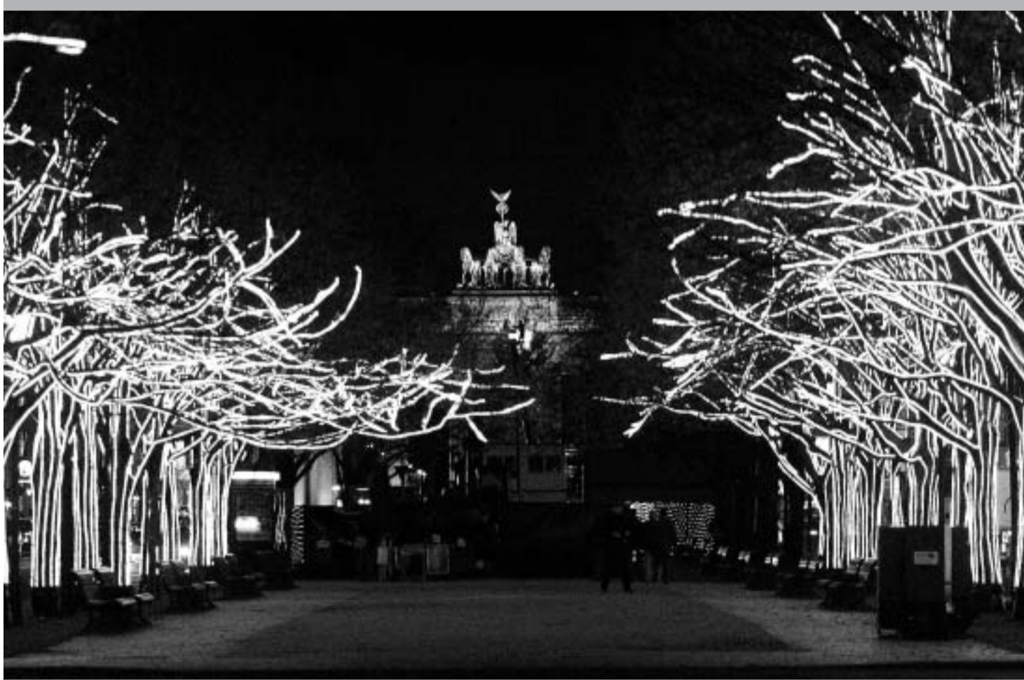
Lichterglanz Unter den Linden, Weihnachtsstimmung allerorten?