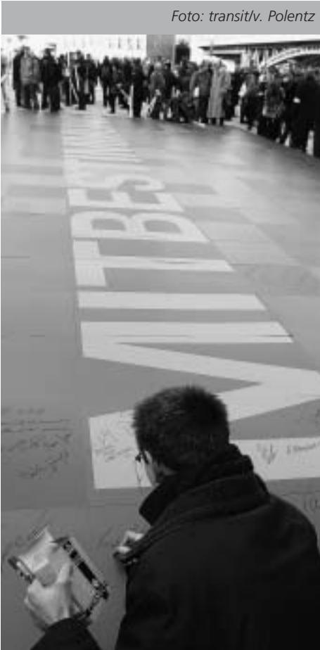
Aktion am Arbeitbertag

Die Mitbestimmung ist ein Irrtum der Geschichte, verkündete Michael Rogowski, der Präsident des Bundesverbandes der Deutschen Industrie (BDI), via Stern-Interview. Damit läutete er eine neue Runde in der öffentlichen Debatte über die Mitbestimmung ein, die als konzertierte Aktion in einem Reformvorschlag einer Expertenkommission des BDI und BDA (Bundesvereinigung der deutschen Arbeitgeberverbände) mündete.